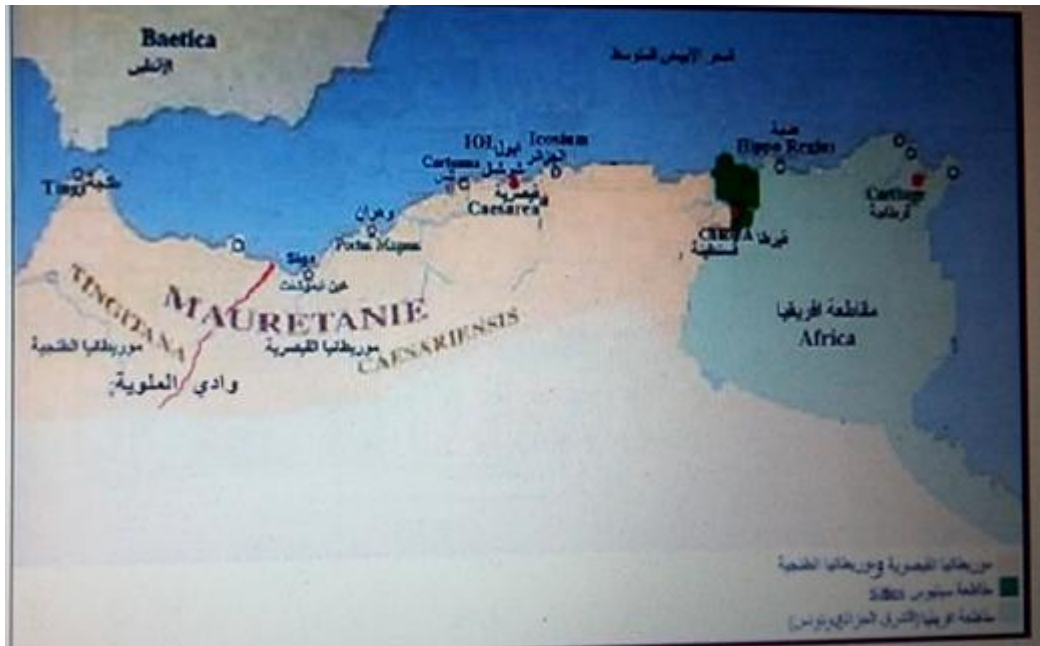
الخريطة رقم (02)

سقطت مملكة موريطانيا على يد الامبراطور "كايس قيصر" (Caius Csear) المعروف بـ"كاليغولا" (Kaligula) بعدما اقدم على اغتيال "ببليموس" ابن "يوبيا الثاني"، في ظروف غامضة، واستولى على ثروته وضم مملكته (اي موريطانيا) الى الدولة الرومانية، التي اقدمت على تقسيمها سنة 42م الى مقاطعتين هما "موريطانيا القيصرية" في الشرق و"موريطانيا الطنجية" في الغرب يفصلهما نهر ملوية (Mulucha). انظر الخريطة رقم 02