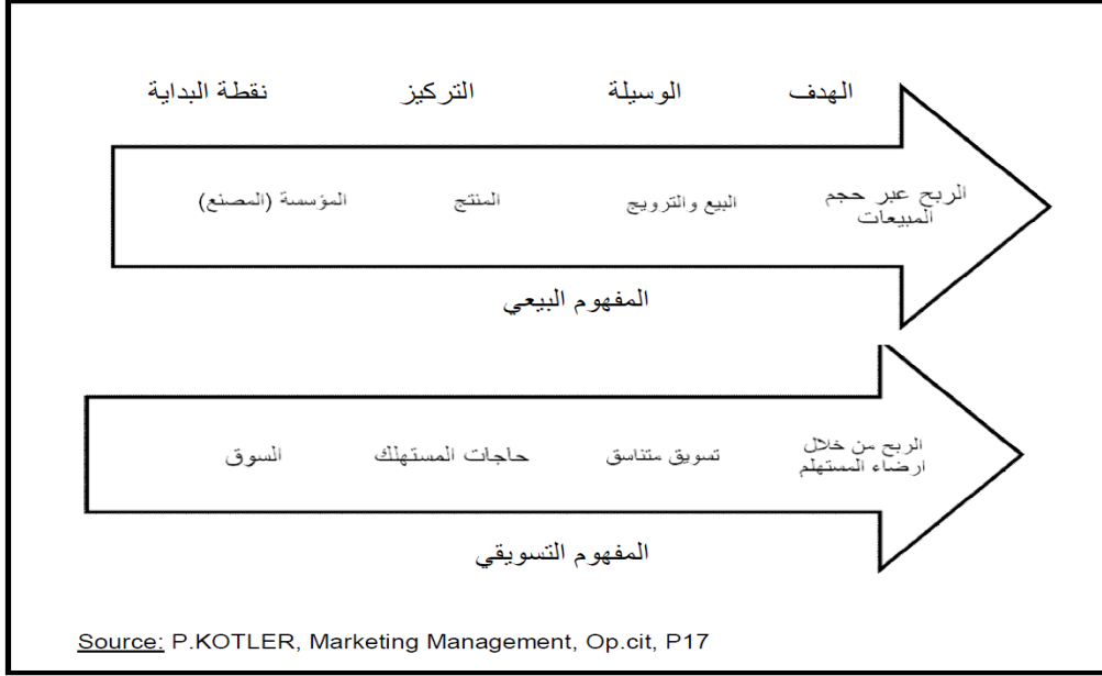
شكل(01):التوجه البيعي والتوجه التسويقي

وكتوضيح أكثر لنقطة التحول بين المفاهيم السابقة والمفهوم التسويقي لدينا الشكل التالي: